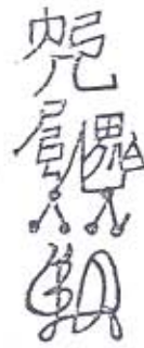
《新集周公解夢書》(右)與《周公解夢全書》(左)穰除惡夢符