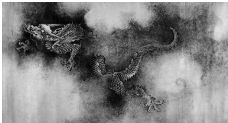
南宋 陳容 九龍圖卷（局部），大約從唐代起，龍的造形已基本固定。

既然龍是種想像的動物，那麼牠的行為當然也出於想像。《說文》：「龍，鱗蟲之長，能幽能明，能細能巨，能短能長，春分