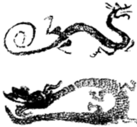
【圖四】《山海經圖考》卷之四，張之傑撰，1937年。

漢畫中的龍，可大別為獸形（左上）、蛇形（右上）、蛇形（左下）、鱷形（右下）等4類。