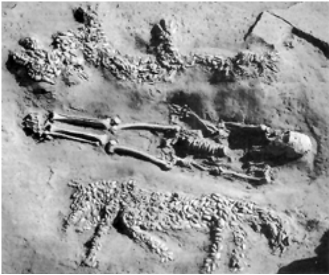
(中世紀) 仰韶文化遺址墓葬貝砌龍(上)、虎圖案。