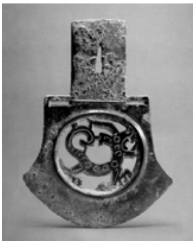
商晚期 透雕龍紋鉞。因配合器型，龍形紋飾作圓形。

等，不論半具象或變形，莫不巨首張口、頭上有角，有時尚有鱗片。戰國時發展出鑲嵌工藝，在青銅上鑲嵌紅銅或銀、金紋飾，戰國早期的「鑲嵌龍紋扁壺」，龍紋已較前複雜。比對商、西周、春秋、戰國青銅器的龍形紋飾，似乎有朝向複雜化演變的趨勢。