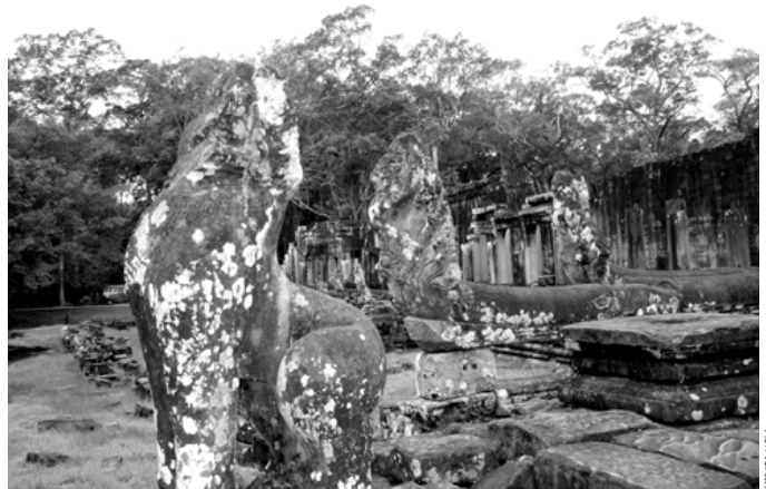
印度教神殿常有那伽雕像。圖為吳哥窟巴戎寺山門之護法石獅與九頭那伽。