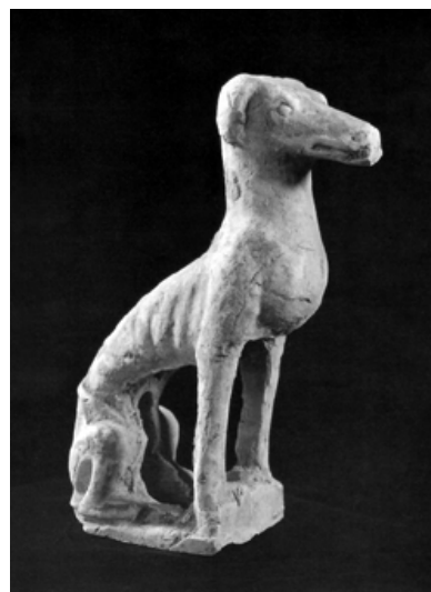
唐 彩繪細犬俑，為陪葬明器，形象唯妙唯肖，細犬特徵無不畢現。引自張隆盛先生輯《中國古犬》一書。

不過筆者的直覺缺乏直接證據佐證，岩畫或青銅器鑲嵌紋上雖繪有獵犬，但繪製粗枝大葉，不易分辨品種。這個問題還須搜集更多史料，才能得出答案。📖（本文圖片由作者提供）