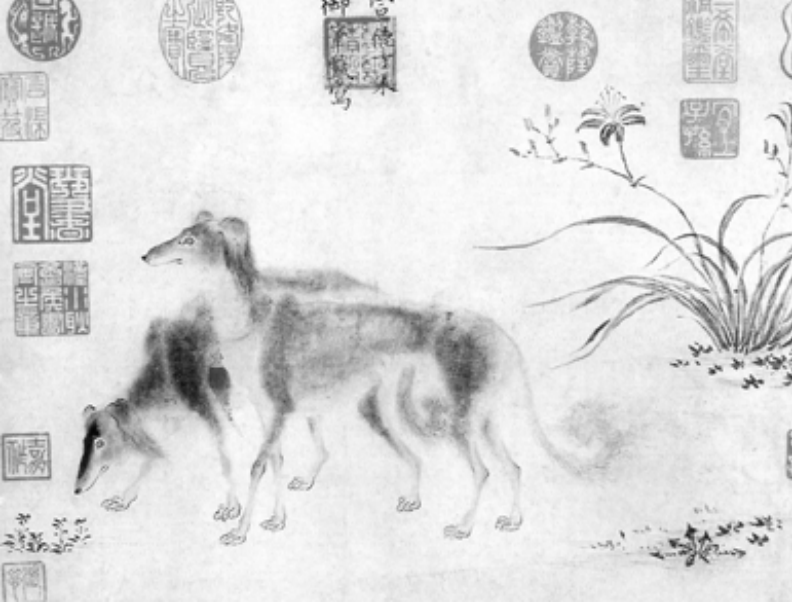
明宣宗 萱花雙犬，從披散的耳毛和尾毛，可確定是原產中東的薩魯奇細犬。 明代永樂、宣德朝中外交通頻繁，兩隻細犬極可能是國外貢品。