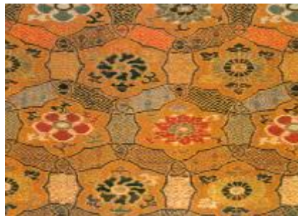
圖二、明代盤條紋宋式錦。

文中的「盤條」，系一種紋樣，其式樣如現故宮博物院所藏明代盤條紋宋式錦（圖二）。這件織物以橘黃色經緯線織地，又以橘黃色紋經，與藍、綠、紅、黃、片金等紋緯交織成曲水、古錢、龜背、矩紋、回紋、鎖子紋等花條，花條的末端互相環套，組成連環式骨架，內填織寓「富貴長壽」之意的四季花卉，花卉的花紋橫向交錯排列，每排花色都不相同，盤條骨